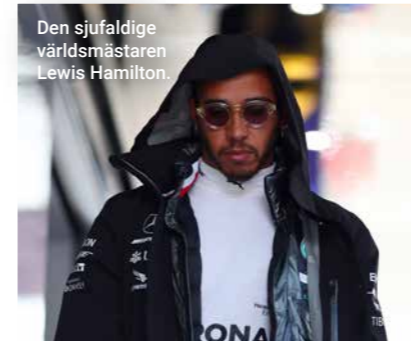
Den sjufaldige världsmästaren Lewis Hamilton.